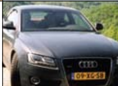
A5, comfortabel en snel

Het comfort wordt verhoogd door de klimaatbeheersing (met drie zones zodat de bestuurder en voor- en achterpassagiers hun eigen temperatuur kunnen instellen), het Bang en Olufsen Soundsysteem (of je daar nu 14 speakers voor nodig hebt betwijfel ik, maar het klinkt geweldig en niet te vergeten het MMI